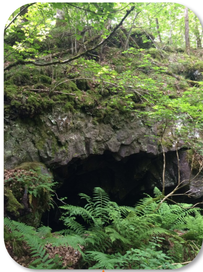
LA GROTTTE NOIRE À gauche de l'entrée principale