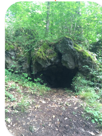
LA PETITE GROTTTE Attention à votre tête !