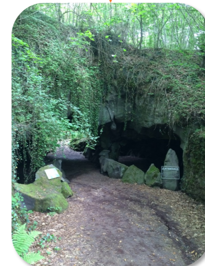
L'ENTRÉE DU THÉÂTRE Sous une pierre griffée