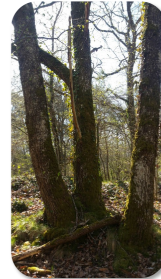
LES TRIPLÉS Au pied d'un des trois