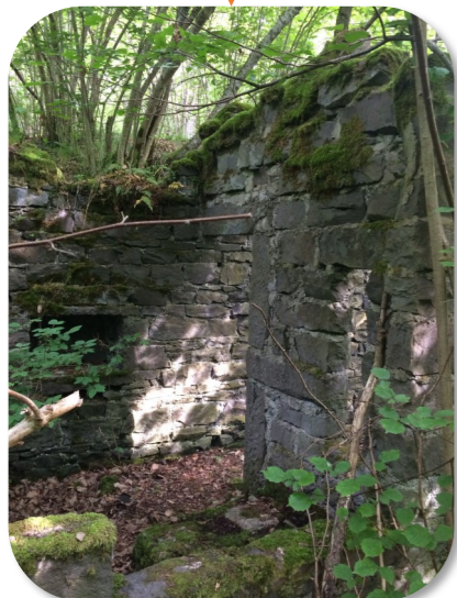
LES RUINES 5m 2 lui suffisent pour se cacher ...