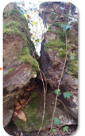
LA CHÊNAIE Cherchez un rocher fendu