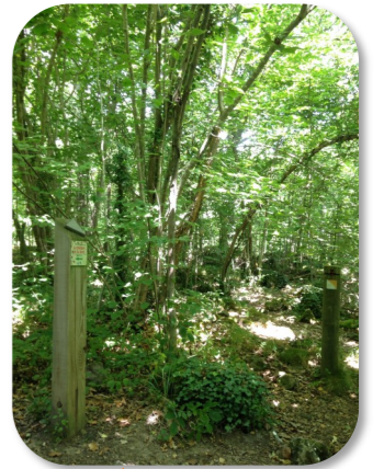
LE TOURNANT DE L'ACTE 6 Elle ne touche pas le sol