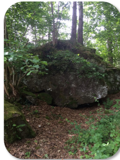
AU PIED DU ROCHER Tout est dans le titre