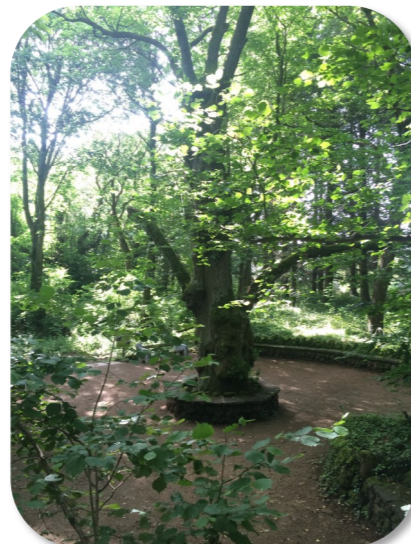
L'ARBRE FENDU Non loin d'un beau châtaigner ...