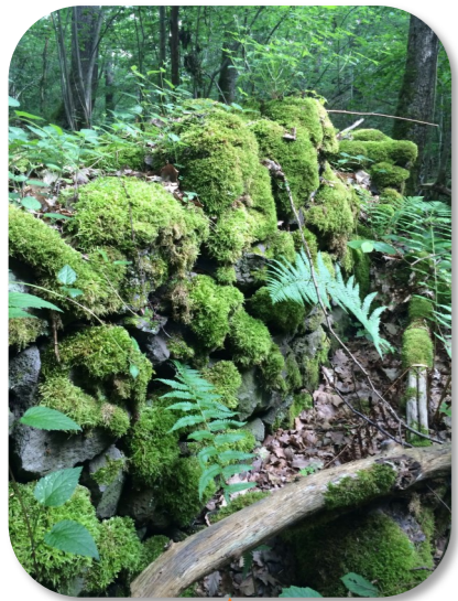
LE MUR DE PIERRE Ne restez pas au pieds du mur